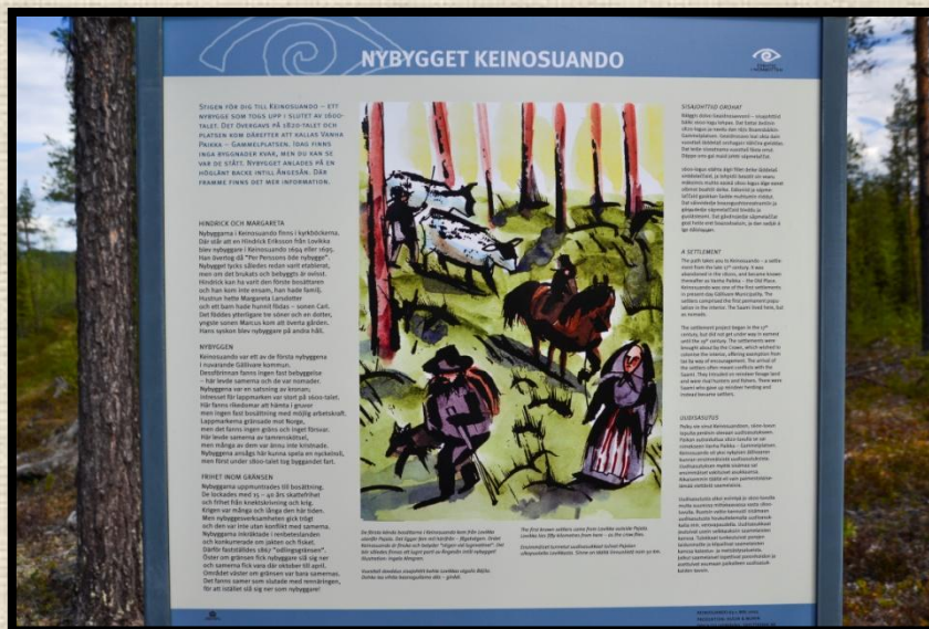
Informations skylt Keinosuando. Foto: Per Berglund 2015.

Jag börjar som vanligt är när jag besöker historiska platser, med att läsa den informationsskylt som finns uppsatt och som berättar byns historia i korthet.