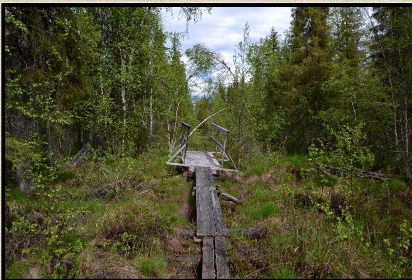
Den stundtals spångade stigen fram till Keinosuando.

Efter att vi gått efter en stig som stundtals var lite svår att forcera för mina gamla ben och min värkande kropp, kom vi fram till den övergivna byn.