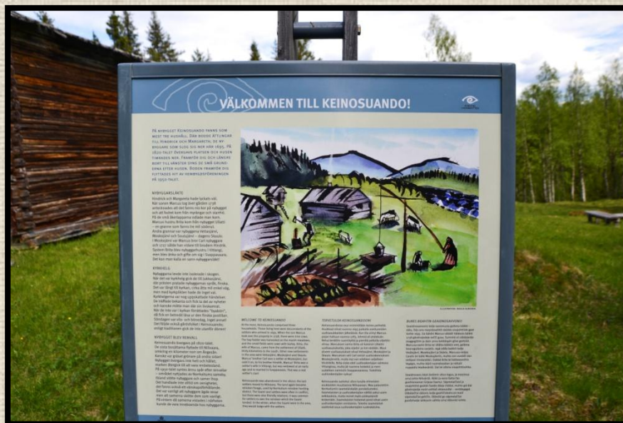
Informationsskylt nummer två. Foto: Per Berglund 2015.

Nybyggarna uppmuntrades till bosättning. De lockades med 15-40 års skattefrihet och frihet från knektutskrivning och krig. Kringen var många och långa den här tiden. Men nybyggesverksamheten gick trögt och den var inte utan konflikt med samerna. Nybyggarna inkräktade i renbeteslanden och konkurrerade om jakten och fisket. Därför fastställdes 1867 'odlingsgränsen'. Öster om gränsen fick nybyggare slå sig ner och samerna fick vara där oktober till april. Området väster om gränsen var bara samernas. Det fanns samer som slutade med rennäringen, för att istället slå sig ner som nybyggare!"