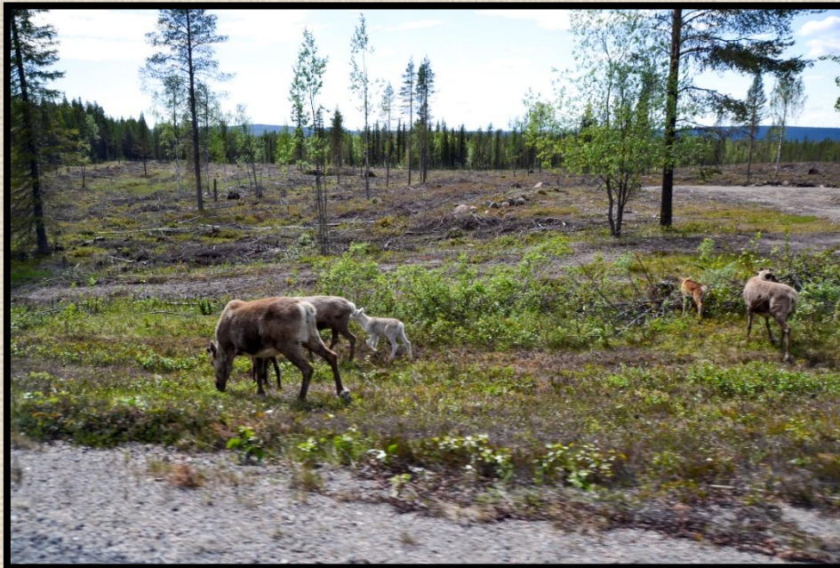
Renar på skogsvägen vid stigen till Keinosuando.

Vi började sedan vår vandring tillbaks längs den långa och stundtals spångade stigen fram till skogsvägen där vi ställt bilen.