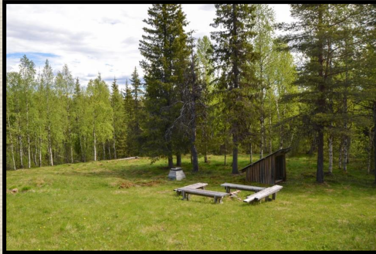
Rastplats vid Keinosuando. Foto: Per Berglund 2015.

egna gener, satte jag mig ner och "mediterade" ett tag på den rastplats som troligen hembygdsföreningen ställt i ordning.